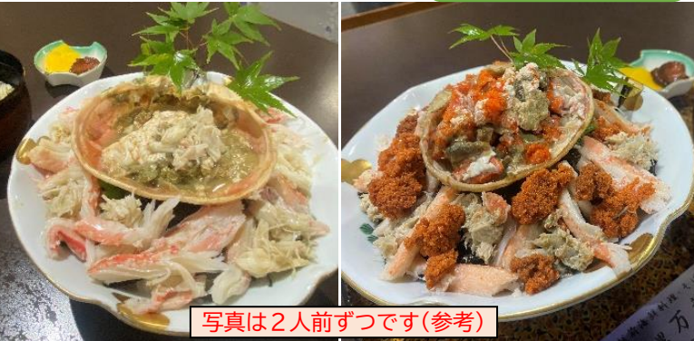
写真は2人前ずつです(参考)

おしながき… ①ズワイガニ丼(ハーフサイズ) ②せいこ蟹丼(ハーフサイズ) ③汁物 ④漬物