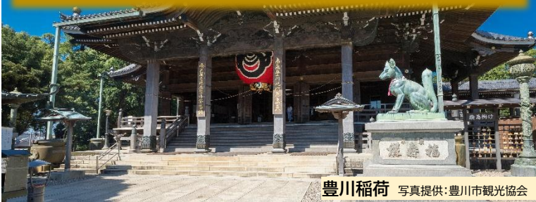
豊川稲荷