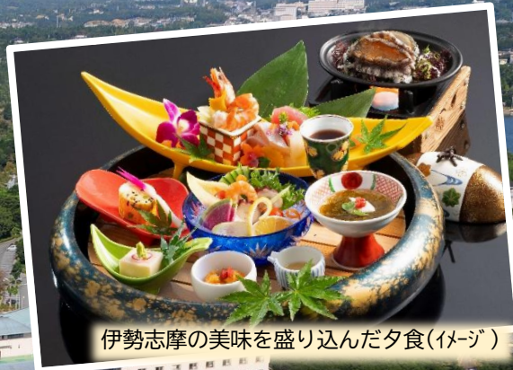
伊勢志摩の美味を盛り込んだ夕食(イセジ)