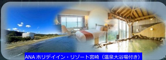
ANA ホリディン・リゾート宮崎 (温泉大浴場付き)

★宿泊先: ①日目 さんふらわあ (プライベートベッド) ②日目 ANAホリディン・リゾート宮崎 (洋・和室) ③日目 さんふらわあ (プライベートベッド) 【フェリーROOM ランクアップ】※往復1名様代金 スーパーリア1名利用@10,000円 2名利用@5,000円