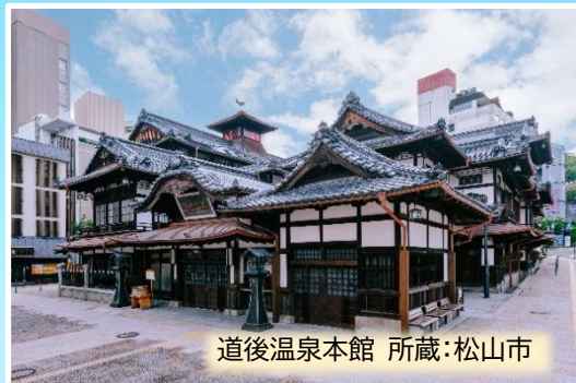
道後温泉本館