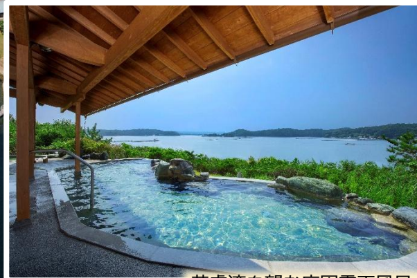
英虞湾を望む庭園露天風呂

★宿泊先:伊勢志摩温泉「賢島宝生苑(かしこじまほうじょうえん)」 燦陽棟(さんようとう)