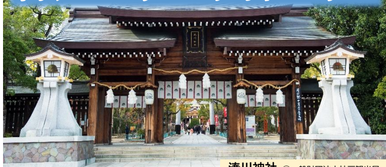
湊川神社