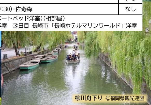
柳川舟下り