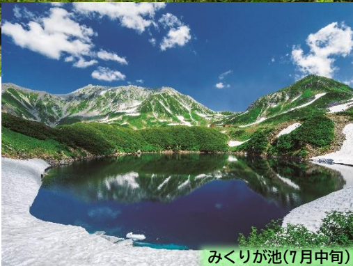
みくりが池(7月中旬)