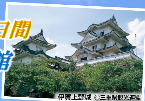
伊賀上野城