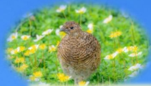
チングルマと雷鳥(8月上旬)