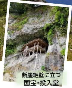
断崖絶壁に立つ 国宝・投入堂